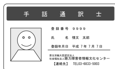
手話通訳士カード

住所 郵便番号、住所(都道府県名から、建物名、部屋番号まで)を記入してください。